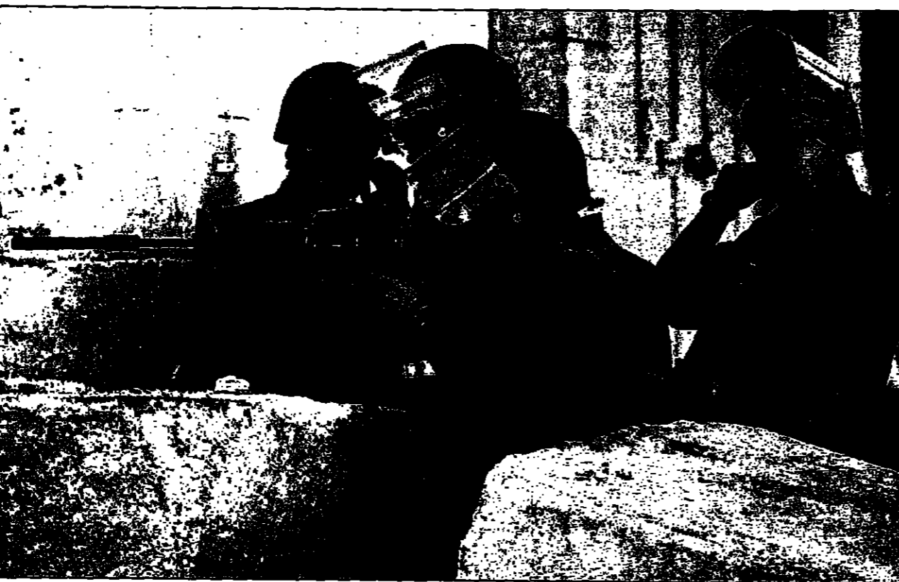
جنود إسرائيليون يسدون أنفهم بينما يقوم زعيمهم بإطلاق الرصاص على الفلسطينيين في الخليل (رويترز)

غزة - والقدس العربي - من ماجد عبد الهادي: أعلنت السلطة الوطنية الفلسطينية أمس ان الجهود المصرية لفتح المفاوضات مع الاحتلال الإسرائيلي، وصلت الى نقطة حرجية، حيث ان الجانبين لم يتوافقا على شروط مقترحة من قبل الجانب الإسرائيلي. وقال وزير الخارجية الفلسطيني ياسر عرفات الذي وصل الى القاهرة أمس، انه سيتوجه اليوم للقاء الرئيس المصري محمد مرسي، لبحث مع الرئيس حتمية مباداة في الجهود المصرية للسلامة في الضفة الغربية والقطاع. وقال عرفات في مؤتمر صحفي عقب مصادفة امس الاول مع الرئيس مرسي، ان مصر تحاول ايجاد حل للنزاع الفلسطيني الإسرائيلي، وانه يتوقع ان يوقع مع الرئيس مرسي بياناً مشتركاً، يدين فيه الاحتلال الإسرائيلي لانتهاكاته في الضفة الغربية والقطاع، وانه يتوقع ان يوقع مع الرئيس مرسي بياناً مشتركاً، يدين فيه الاحتلال الإسرائيلي لانتهاكاته في الضفة الغربية والقطاع.